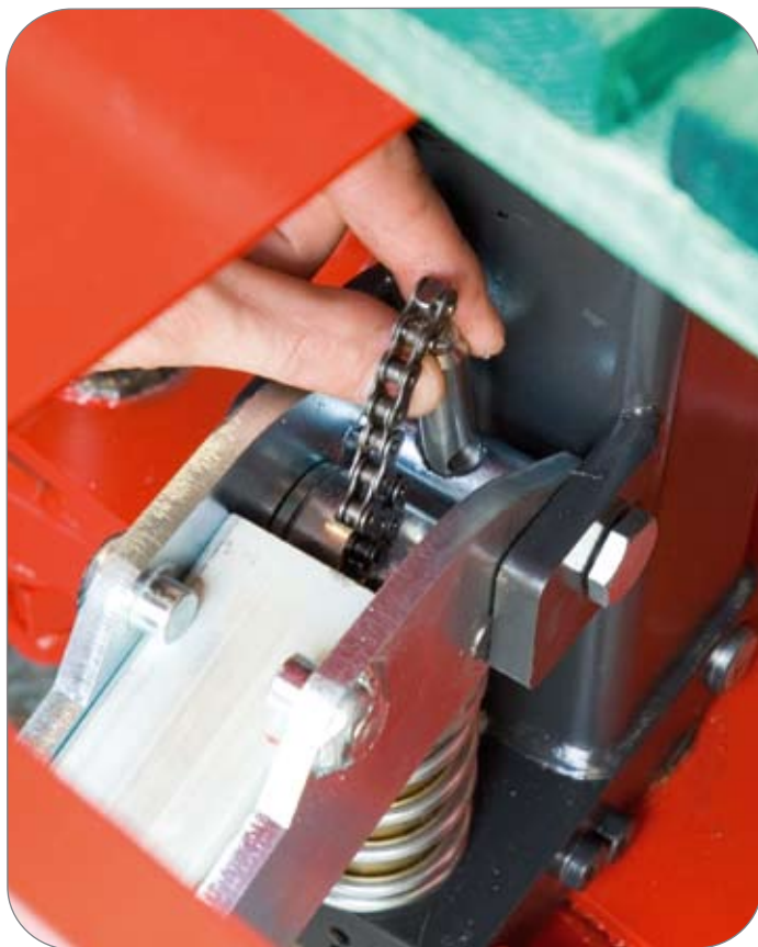
Justering av kjedefestet i hydraulikken