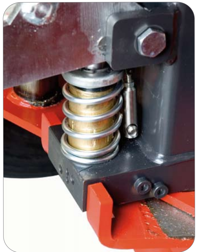
Kjedefestet på plass